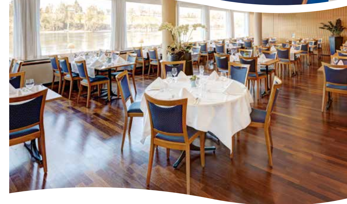
Oben: Restaurant Rhyblick Unten: Rheinsaal