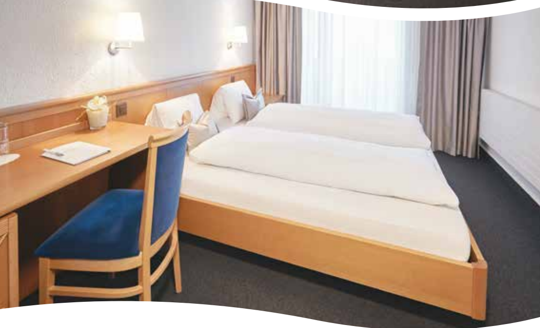
Oben: Junior Suite mit Rheinsicht Unten: Doppelzimmer mit Rheinsicht